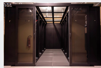
Datacenter „Datarock“ in Nottwil (LU)